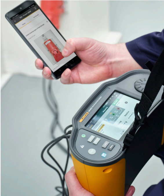
Wijs foto's rechtstreeks toe aan specifieke meetpunten voor meer gedetailleerde documentatie