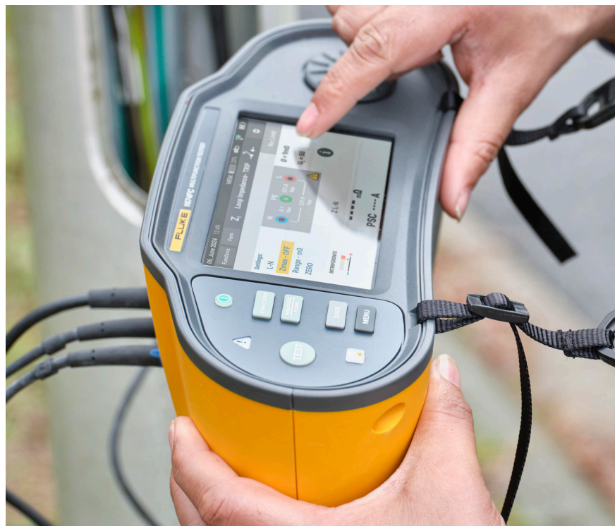
Kleurentouchscreen en tastbare draaiknop voor snelle navigatie

Vereenvoudig het genereren van rapporten met automatische rapportpopulatie, Fluke Connect-integratie en rapportage met één druk op de knop met de Fluke TruTest™-software.