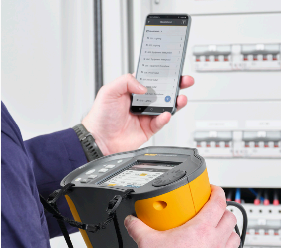
Verminder de handmatige gegevensinvoer en het bijhouden van de administratie